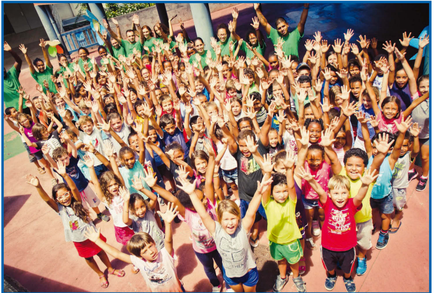
Cette année, le centre de loisirs des 6-11 ans des Avirons est installé dans l'école Paul Hermann.