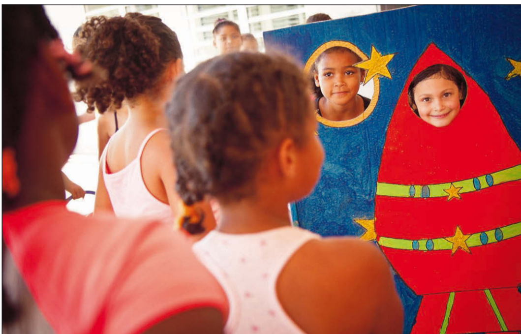
Chacun à son tour, on se fait prendre en photo.