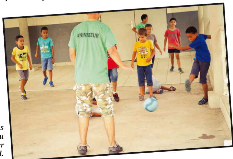
Les garçons ne peuvent pas passer une journée au centre sans jouer au football.