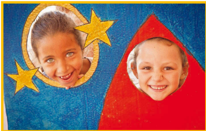
Sur le thème de l'imagination, les enfants partent dans l'espace.